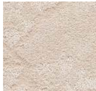
35 / SDN