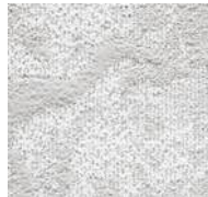
90 / SDN