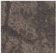
47 / SDN