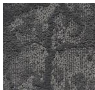
97 / SDN