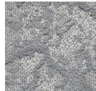
95 / SDN