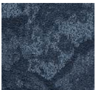
77 / SDN