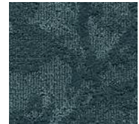
27 / SDN