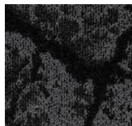
98 / SDN