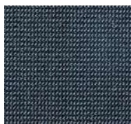
78 / SDN