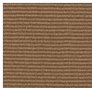
154 / SDN