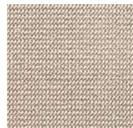
34 / SDN