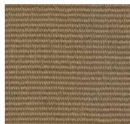
134 / SDN