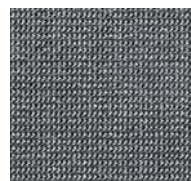
95 / SDN