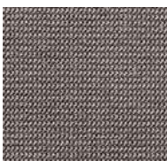
94 / SDN