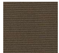
144 / SDN