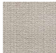
93 / SDN