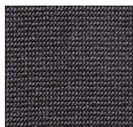
98 / SDN